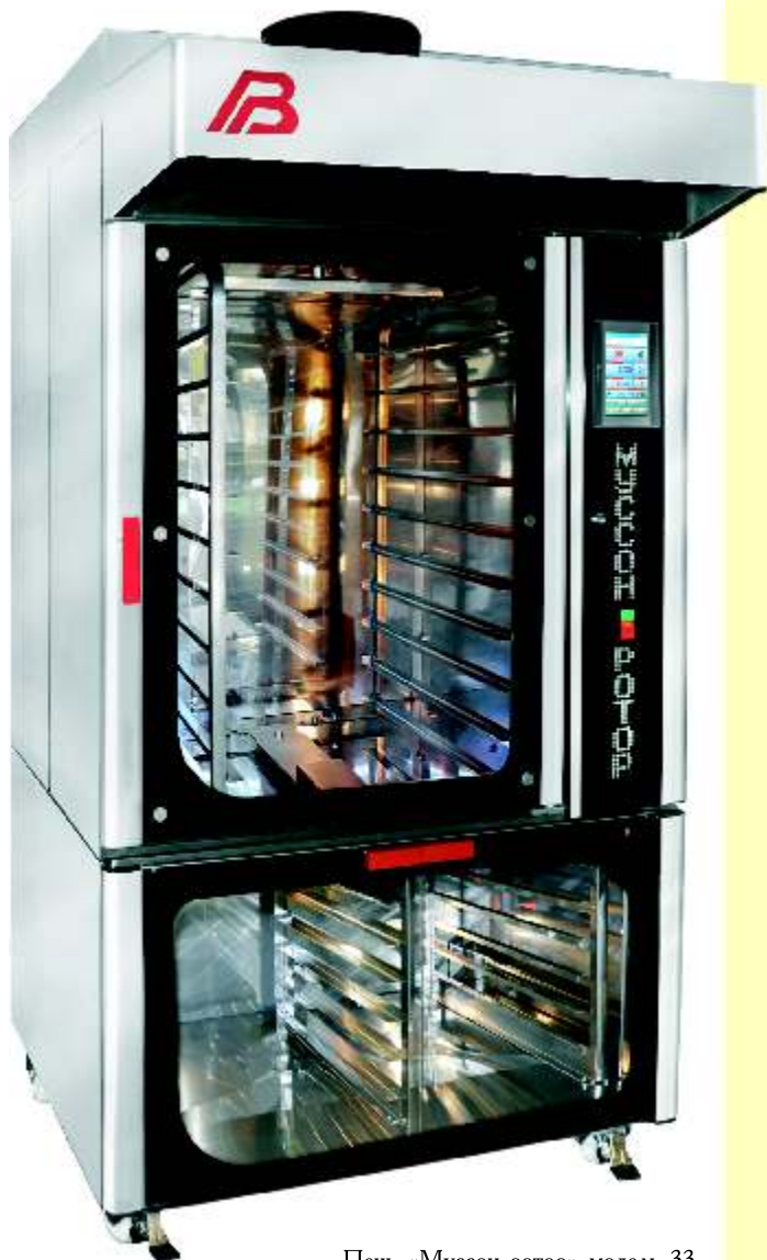
Печь «Муссон-ротатор» модель 33 и расстойный шкаф «Бриз» модель 33