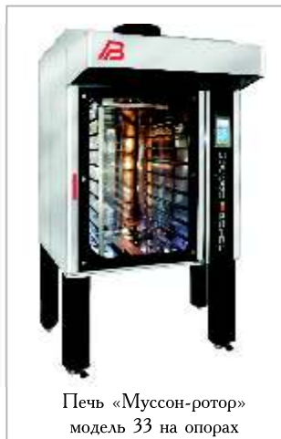
Печь «Муссон-ротатор» модель 33 на опорах